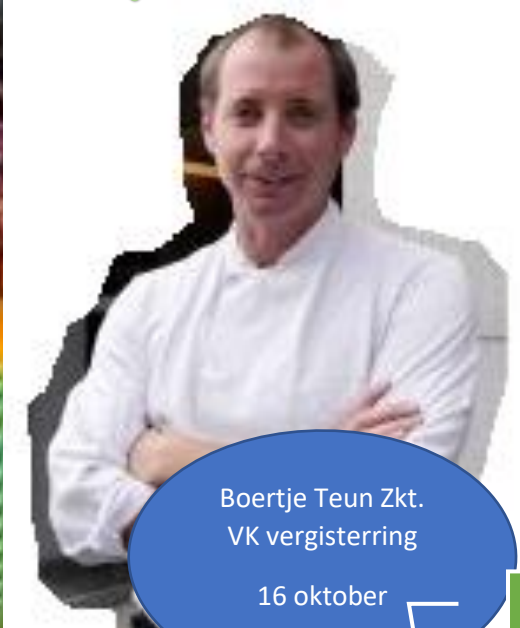
Boertje Teun Zkt. VK vergisterring

[Titel van sidebar] Bakkerijtocht 9 okto